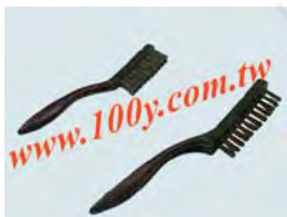
CH212 / CH213