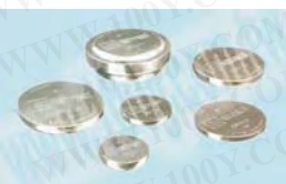
51870 / 51807 / 51871 / 51873 / 51874 / 15325 / 51875