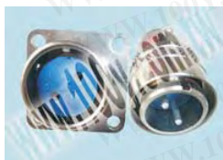
金屬公頭+方形母座連接器