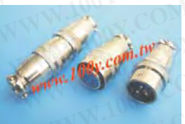
鍍銅金屬母頭+圓形公(頭)座連接器