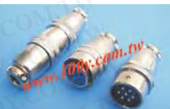
金屬圓形母頭+公頭 連接器