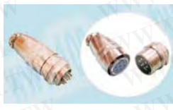
鍍鎳金屬母頭+圓形公(頭)座連接器