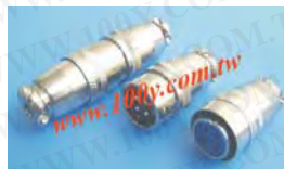
金屬母頭+公(座)頭連接器