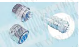
鍍鎳金屬連接器-母頭