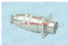
鍍銅金屬母頭+圓形公(頭)座連接器