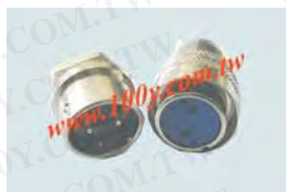
金屬母頭+圓形公(頭)座連接器