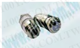
鍍鎳金屬連接器 母頭+圓形公座