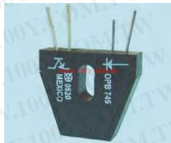
OPB742 / OPB745