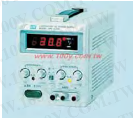
GPS-1830D / 3030D