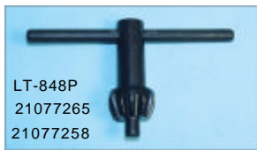
LT-848P 21077265 21077258