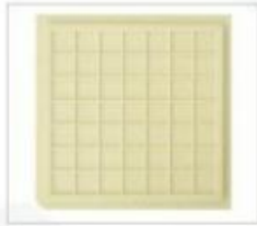
型号:NH20-210*210-24 格子尺寸: 5.33*5.33*0.61mm