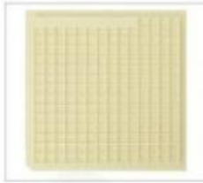
型号:NH20-105*110-28 格子尺寸: 2.67*2.79*0.71mm