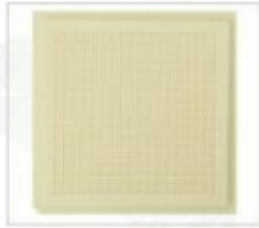
型号:NH20-20*20-15 格子尺寸: 0.51*0.51*0.38mm