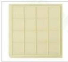
型号:NH20-411*411-30 格子尺寸: 10.44*10.44*0.76mm