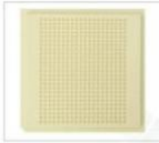
型号:NH20-48*46-22 格子尺寸: 1.22*1.17*0.56mm