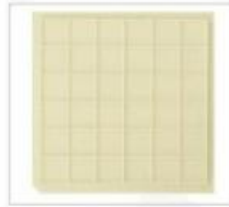
型号:NH20-280*280-30 格子尺寸: 7.11*7.11*0.76mm