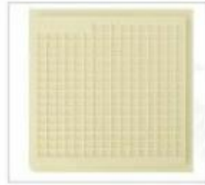
型号:NH20-90*80-24 格子尺寸: 2.29*2.03*0.61mm