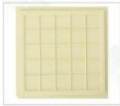
型号:NH20-300*300-30 格子尺寸: 7.62*7.62*0.76mm