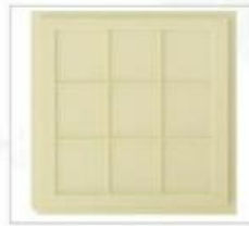
型号:NH20-480*510-30 格子尺寸: 12.19*12.95*0.76mm