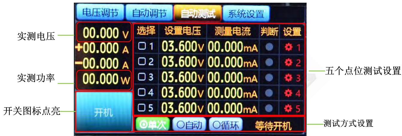
图5.6.3 电池自动参数启动设置

通过完成电池自动参数单步设置，根据具体测试方法选择，这里以单次测试为例，点击LCD屏上开关按钮。启动测试，自动测试会在产品连接重新接入后开始测试，方便产品测试。循环测试，产品需要不同点位一直老化测试或是其他用到此项，可选择该项进行测试。如图5.6.3所示。