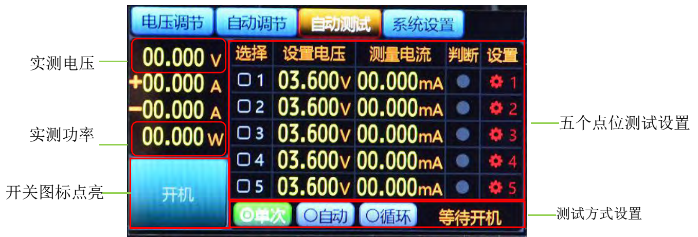
图5.6.1 电池充放电自动测试