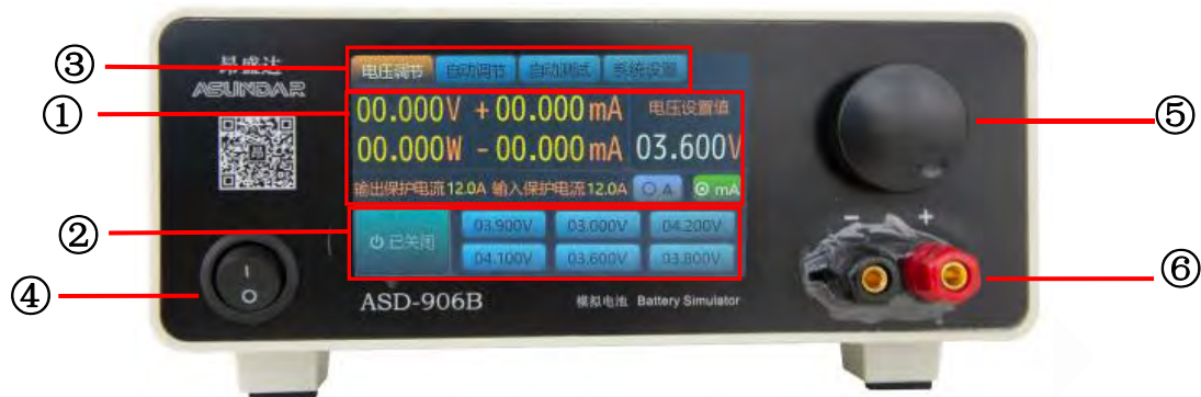
图 2.2.1 ASD906B 前面板

开关按钮(ON/OFF)用于开启或关闭模拟电池设备，红黑接线柱为模拟电池（Battery）输入和输出的电能传输接口；LCD触摸显示屏含参数设置，参数显示，菜单设置及开关等功能；调节旋钮（带触压按键）可微调电压或电流参数。操作详情见第五章。