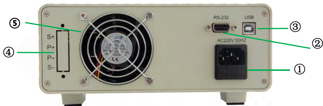
图 2.3.1 ASD906B 后面板

ASD906B 模拟电池后面板含设备电源插座（带保险丝）、通讯接口、远程输出端子和散热窗口，如图 2.3.1 所示。