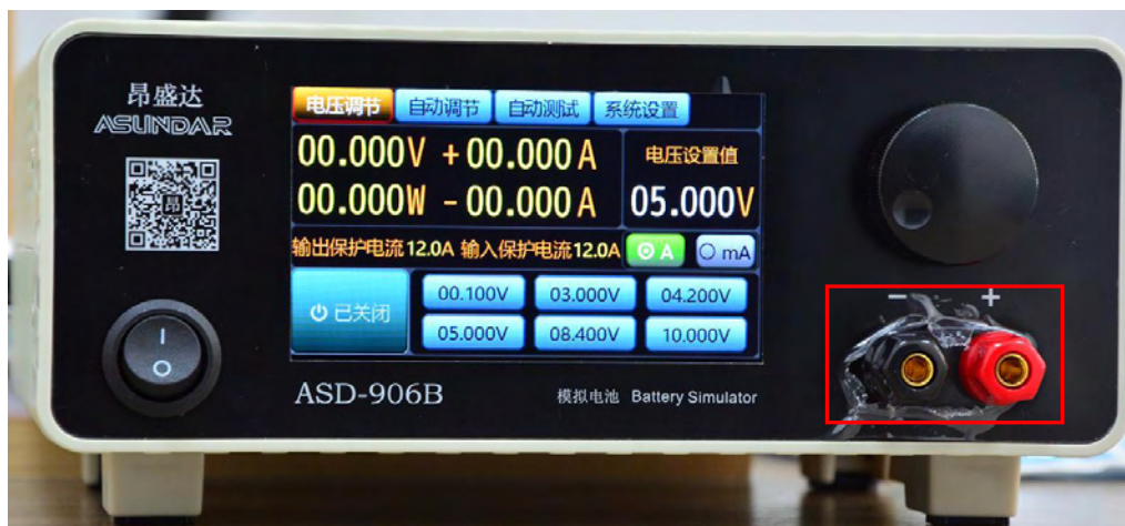
图 6.1.1 模拟电池前面板