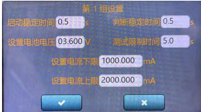
图5.6.2 电池自动参数单步设置

通过点击设置栏下的设置图标键，可进行电池具体测试点设置，例如正常锂电池充电特性测试过程，启动稳定时间0.5s，判断稳定时间0.5s，设置电池电压3.6V，测试限制时间为5.0s，为具体测试时间，电池该具体测试点总共花费6.0s时间。根据具体充电电流，设置充电判断范围。如图5.6.2所示。