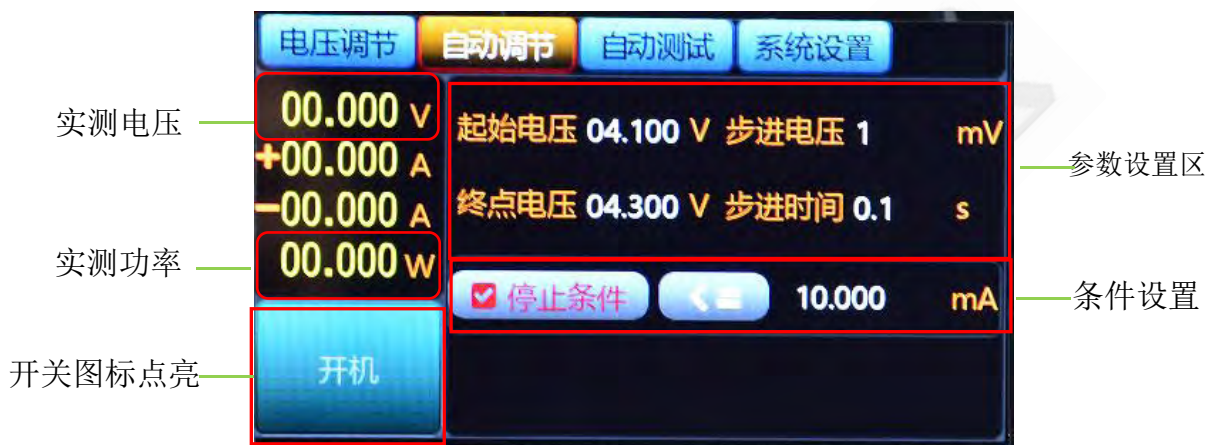
图5.5.1 电池充电饱和和测试

此时ASD906B的LCD屏开关按钮显示为蓝色，当开关按钮显示为红色是测试结束，参数显示区显示电池的充电电压值、电流值及功率值，如图5.5.1所示。