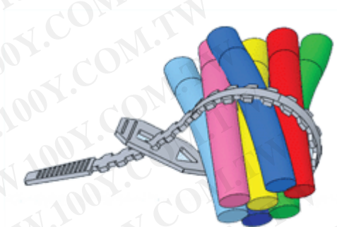
電源線束線帶 WCE 系列產品效果圖