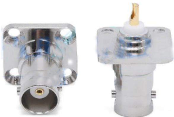
BNC Female Flange RF Connector Adapter