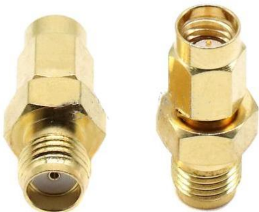
SMA Female to SSMA Male RF Connector Adapter