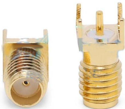
SSMA-KHD PCB Connector