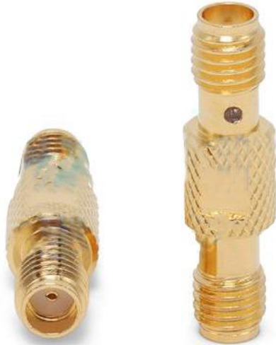
SSMA Female To Female Adaptor