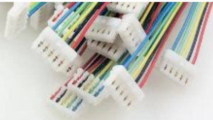
刺破式 0.8mm间距 单头/双头