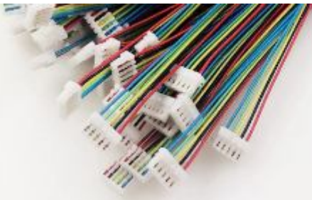
刺破式 0.8mm间距 单头/双头