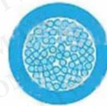
多股软线 (RV) (≥30 根铜丝)