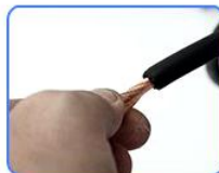
STEP2: 把焊线的铜丝拧成一根绳