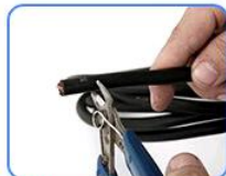
STEP1: 用剪刀把焊线的皮去掉