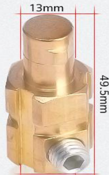
DKJ 35-50 重量: 76g