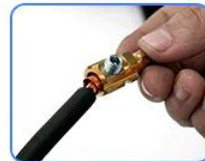
STEP4: 把拧好的铜丝插入接线柱内的铜圈，再用内六角板拧紧