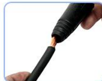
STEP3: 把剪好的焊线穿入胶块插底座