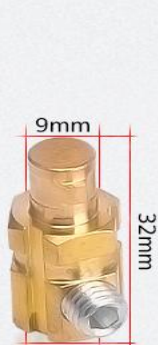
DKJ 10-25 重量: 24g