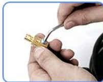
STEP5: 用铜线端子把剥好皮的铜线压紧