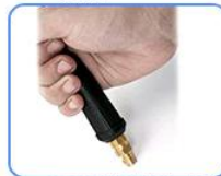
STEP6: 把压好线的接线柱对准橡胶槽口压紧即可