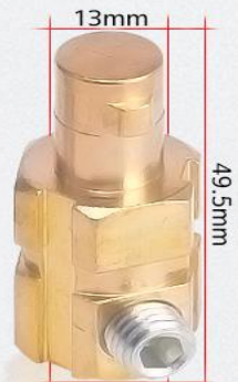
DKJ 50-70 重量: 76g