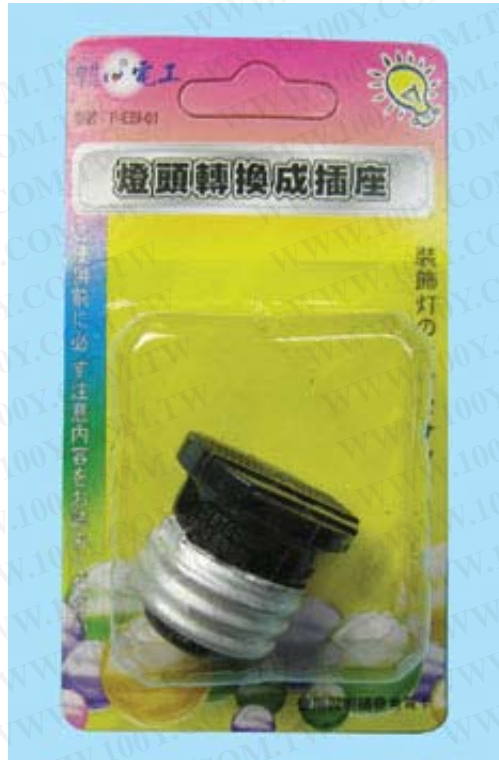
P-EBI-01 燈頭轉換成插座 AC 125 6A