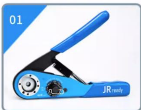
01 工具处于张开状态