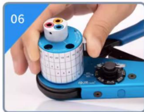
06 按下复位按钮进行复位