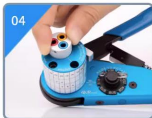
04 旋转定位芯对准白色线