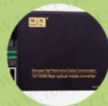
光纤连接 传输设备

勝特力材料 886-3-5753170 勝特力电子(上海) 86-21-34970699 勝特力电子(深圳) 86-755-83298787 Http://www.100y.com.tw