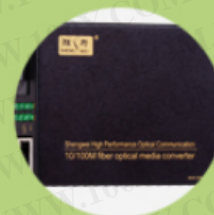
光纤连接 传输设备