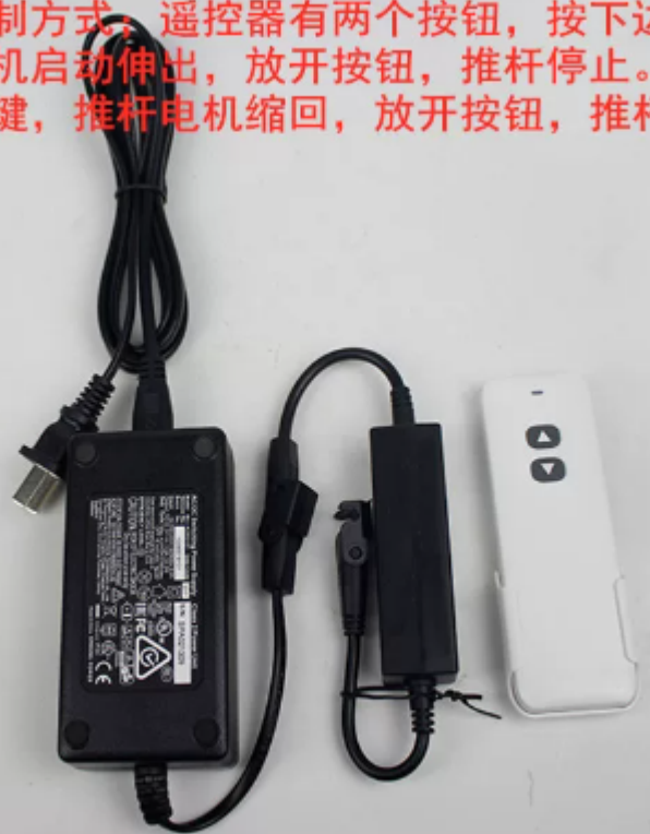
无线遥控器 一拖一 电压24V

点动控制方式：遥控器有两个按钮，按下边键，推杆电机启动伸出，放开按钮，推杆停止。按上边键，推杆电机缩回，放开按钮，推杆停止。