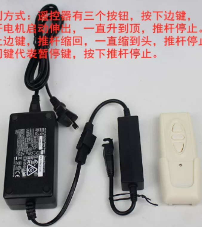
无线遥控器 一拖一 电压24V 带暂停键遥控

控制方式：遥控器有三个按钮，按下边键，推杆电机启动伸出，一直升到顶，推杆停止。按上边键，推杆缩回，一直缩到头，推杆停止。中间键代表暂停键，按下推杆停止。