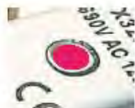
Red non melted 未熔断 (红色)