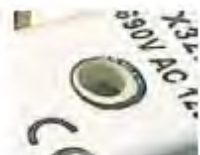
Beige melted 已熔断