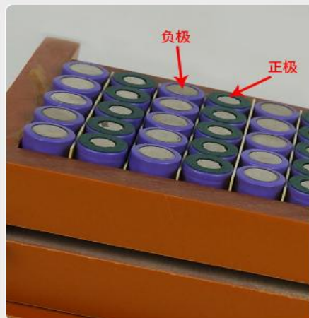
在制作电池组时，同样也 是在正极贴上青稞纸