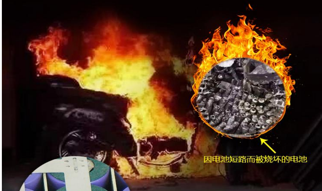
因电池短路而被烧坏的电池

电动车经过日夜奔波和日久老化会使每节电池表面绝缘层磨损，电池正负极之间就容易产生短路情况，一旦发生短路电池就会迅速产生高温并燃烧； 电动车电池自燃事故随处可见，需要在根本上提高电池的安全性。