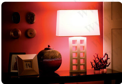
Compact Fluorescent Lamps