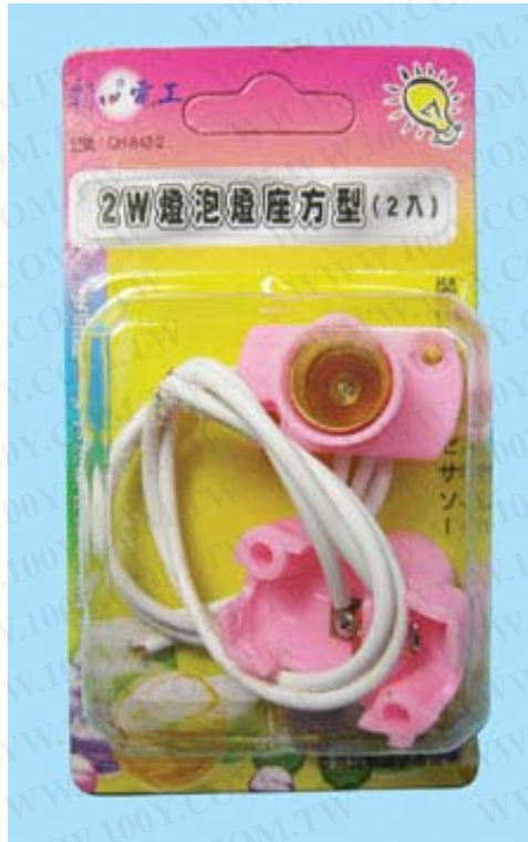
2W 燈泡燈座方型(2入) 規格 AC300V E12

勝特力材料 886-3-5753170 勝特力电子(上海) 86-21-34970699 勝特力电子(深圳) 86-755-83298787 Http://www.100y.com.tw