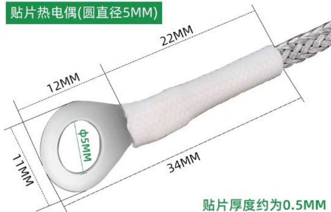
贴片热电偶(圆直径5MM)