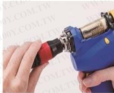
專用吸嘴更換扳手