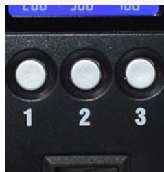
· 三组快捷温度存取键 ·