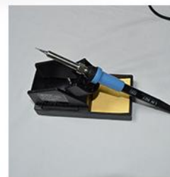
· 烙铁座和主机分离 ·