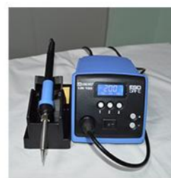
· 软件校温控温功能 ·