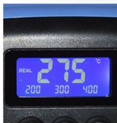
· LCD 大屏显示 ·