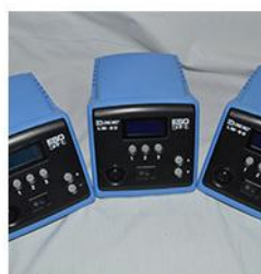
· 低压发热体 ·