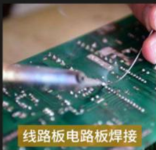
线路板电路板焊接

防止金属表面氧化作用，并能在较高的温度下与焊锡的表面氧化膜反应使之熔解，还原干净的金属表面使焊锡可以焊出满意的焊点来