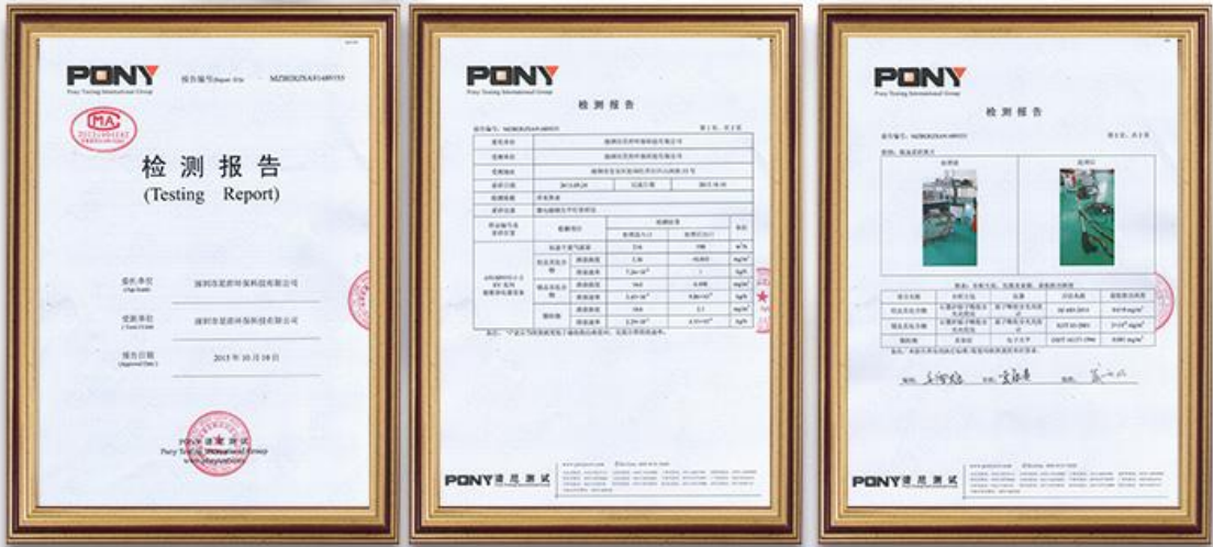
谱尼空气检测报告