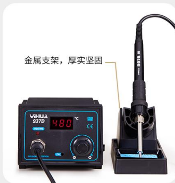
金属支架，厚实坚固