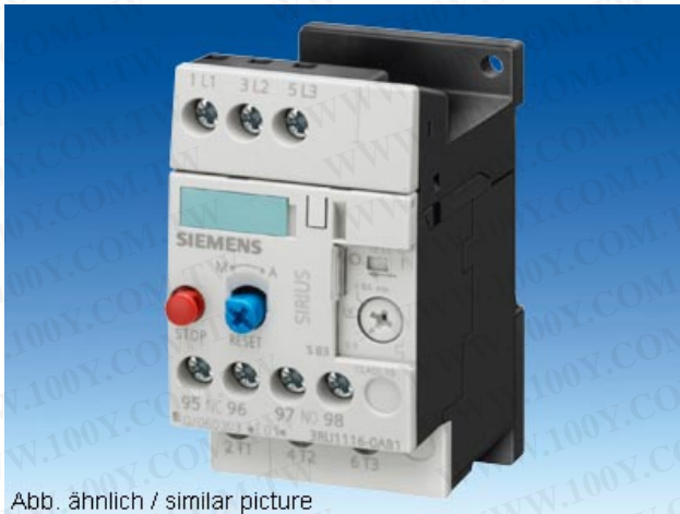
Abb. ähnlich / similar picture

UEBERLASTRELAIS 17...22 A FUER MOTORSCHUTZ BGR S0, CLASS 10 EINZELAUFSTELLUNG HAUPTSTROMKR.: SCHRAUBANS. HILFSSTROMKR.: SCHRAUBANS. HAND- AUTOMATIK-RESET