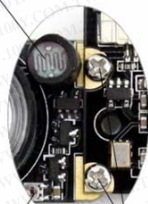
电源兼定位螺丝孔