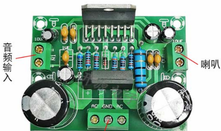
电源输入：双12-36V变压器