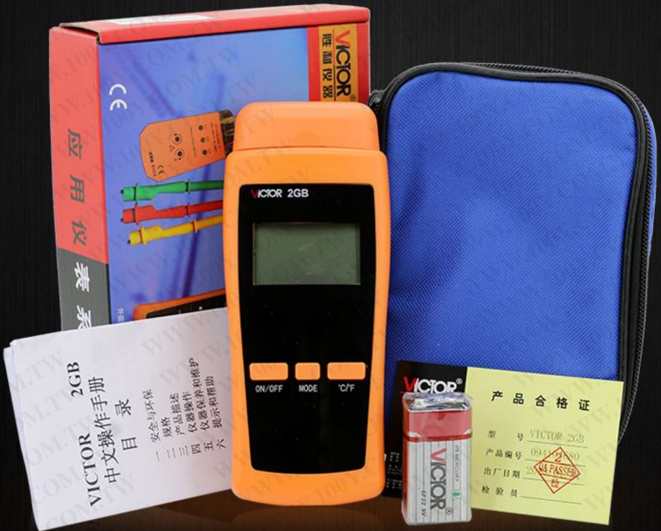
1-主机 2-说明书 3-合格证 4-仪表包 5-9V电池一节 6-彩盒