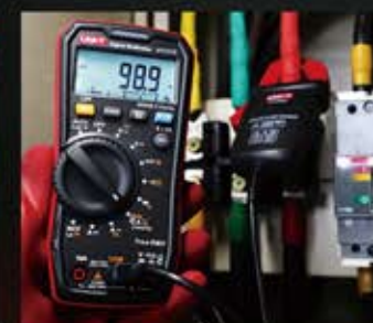
搭配電流鉗 (交流電流測量)