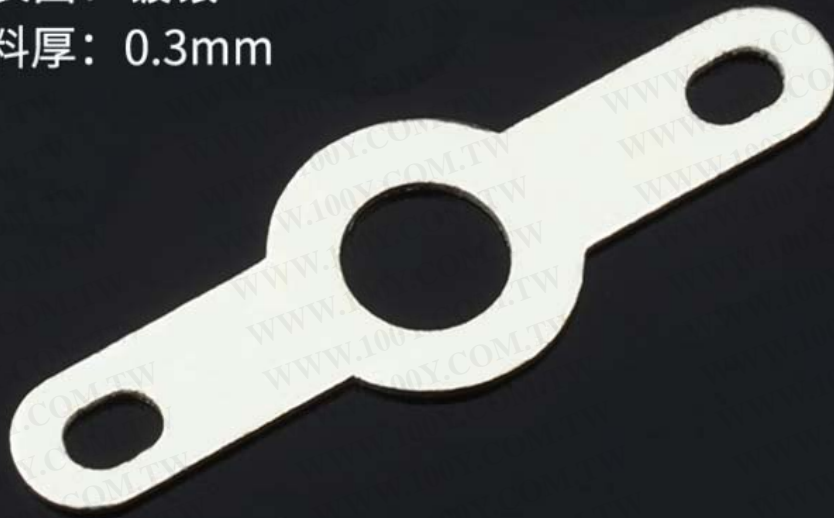
产品尺寸 Product Size