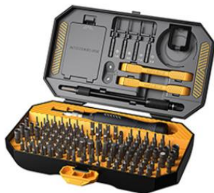
精密螺丝刀套装145件套 JM-8183