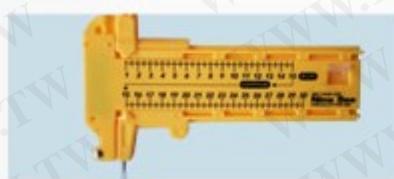
1. 圓規刀 508 附6片小刀片 (SK5高碳鋼) 3根鉛芯, 可畫直徑10MM-300MM