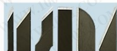
4. 全金屬大刀片 309-1 6片不同形狀刀片 (SK5高碳鋼)