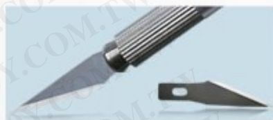
3. 全金屬筆刀 309 鋁杆 配6片不同形狀刀片 (SK5高碳鋼)