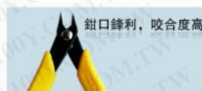
鉗口鋒利, 咬合度高