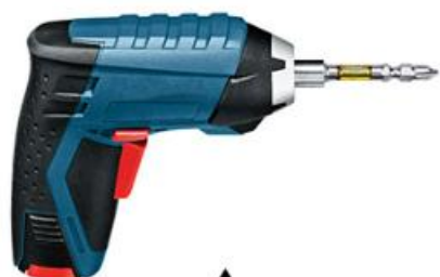
适用于手电钻或充电钻