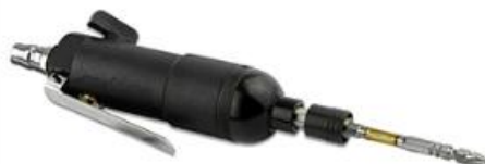
适用于气动螺丝刀