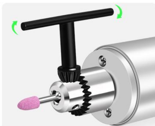
3.插入需要使用的磨头