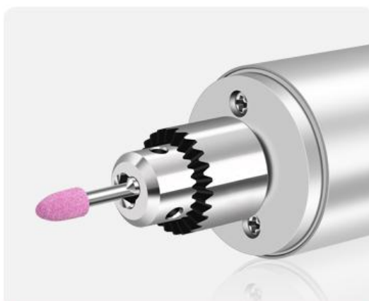
4.顺时针拧紧夹头，即可使用