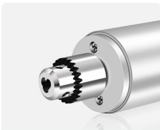
1.新用户刚收到时，夹头为收起状态