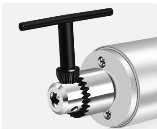
2.扳手顺时针拧出部分三爪