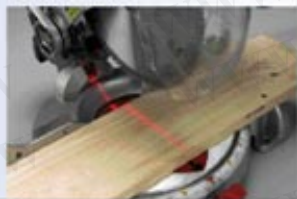
10" 木(鋁)工角度切斷機