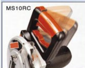
把手角度調整(90° - 0°)