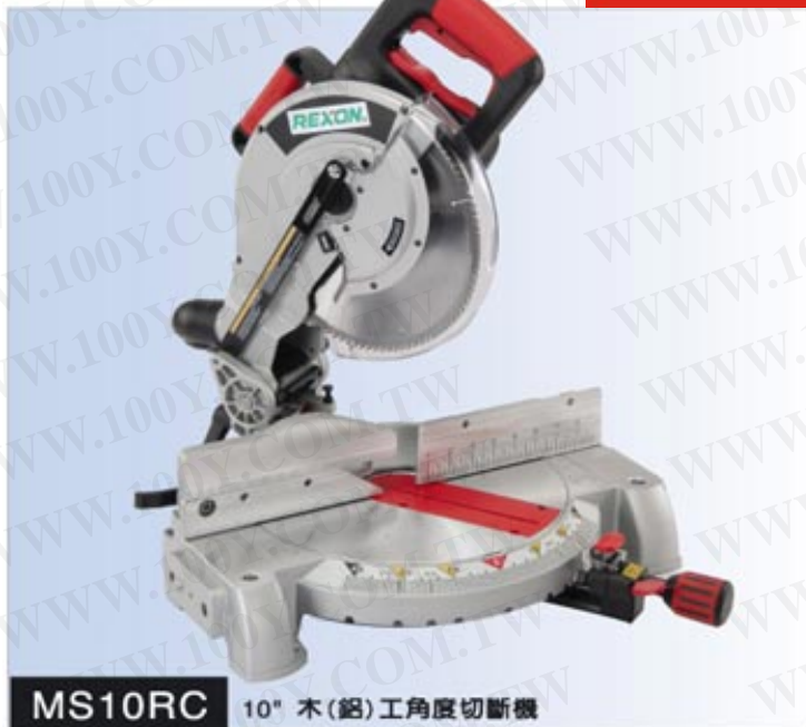
MS10RC 10" 木(鋁)工角度切斷機

勝特力材料 886-3-5753170 勝特力电子(上海) 86-21-34970699 勝特力电子(深圳) 86-755-83298787 Http://www.100y.com.tw