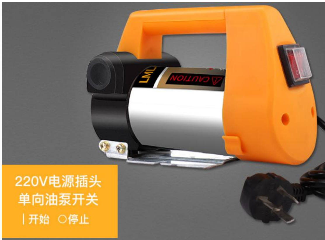
220V电源插头 单向油泵开关 |开始 ○停止