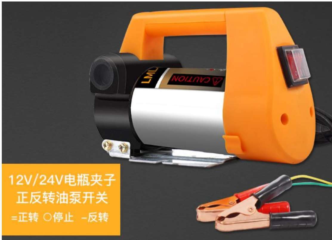
12V/24V电瓶夹子 正反转油泵开关 =正转 ○停止 -反转