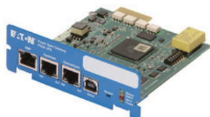
PowerXpert UPS X-Slot card (PXGX UPS) (103007974-5591)