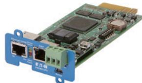
PowerXpert UPS MiniSlot card (PXGMSUPS)

透過乙太網路提供 Web 介面、ModBus TCP、BACNetIP 和 SNMP 通訊。