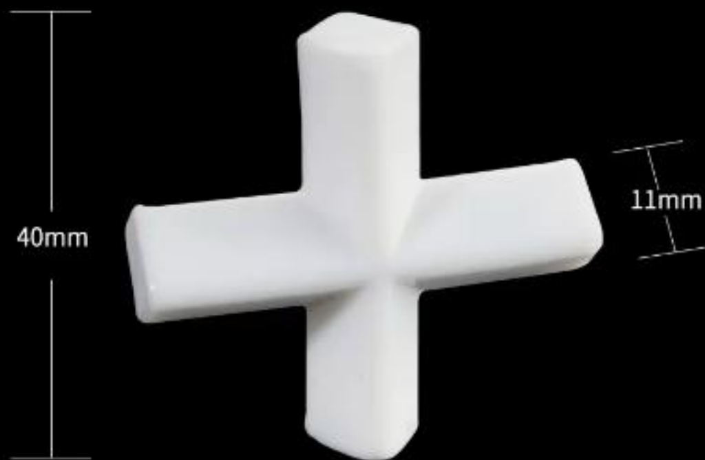
T40 (11*40mm) 搅拌子(十字)