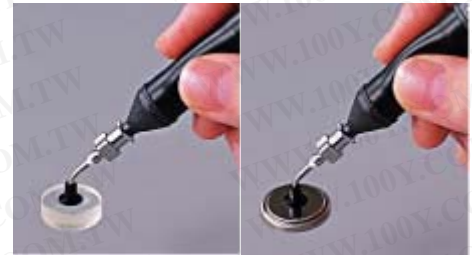
吸附小镜片时 吸附钮扣电池时