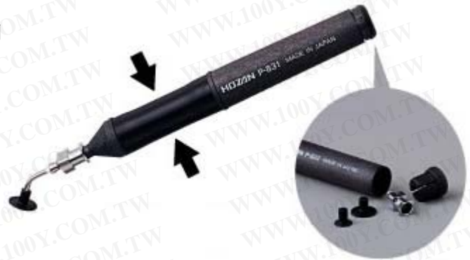
吸笔内可收藏吸垫和吸嘴