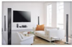
音響系統、家庭劇院、 CD唱盤、擴大機等