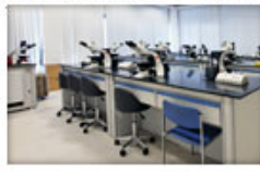
品管中心、實驗室 專業精密儀器