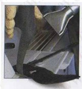
高精 PVC, PU 工程 (機械設備配套)