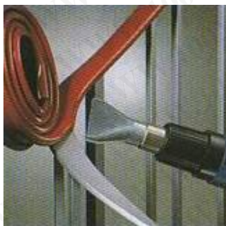
高級塑料欄杆蓋加工

勝特力材料 886-3-5753170 勝特力电子(上海) 86-21-54151736 勝特力电子(深圳) 86-755-83298787 Http://www.100y.com.tw