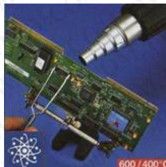
拆除高精密電子組件件